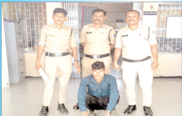
माही की गूंज, धामनोटा

पुलिस ने एक नाबालिग लड़की को शादी का झांसा देकर भगा ले जाने और उसके साथ दुष्कर्म करने के आरोपी को गिरफ्तार कर लिया है। यह कार्रवाई धामनोटा पुलिस द्वारा गठित एक विशेष दल ने मुखबिर की सूचना और तकनीकी साधनों के आधार पर की है।