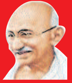
कमजोर कमी क्षमताएँ नहीं हो सकती है, क्षमताएँ ताकतवर की निशानी होती हैं...